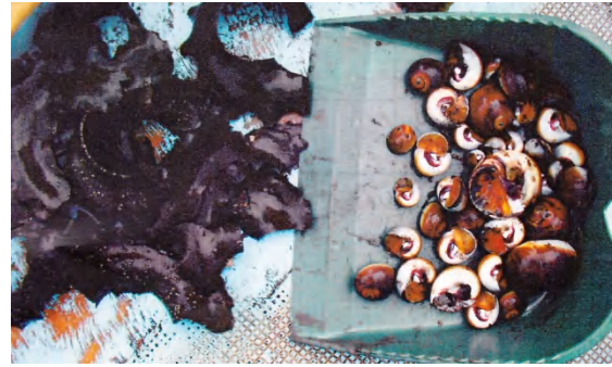
黒く見えるのが砂茶碗（三枚州 貝桁漁獲物 2011年）