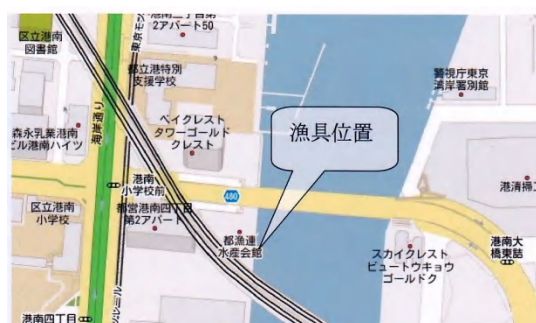
港区港南 4-7-8 (内湾環整協前)