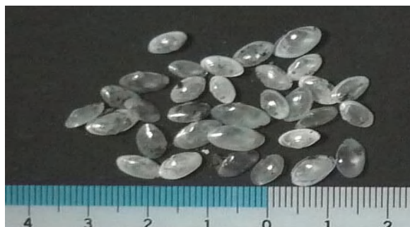
京浜運河 (青野良平 2009年8月)

アサジガイ科 殻長 1cm。殻はガラス状の半透明、殻表は光沢がある。分布は北海道南部以南。汚染指標二枚貝として環境調査では重視。ゴカイ類のヨツバネスピオと共に酸素の欠乏に強く、環境の悪い水質で棲むことができる。潮間帯から水深 60m の泥底に生息する。