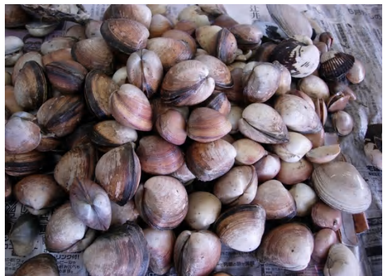
写真左：腰巻籠での漁獲（多摩川河口）